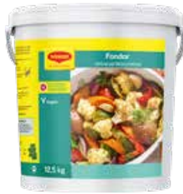
60 MAGGI FONDOR Universal-Würzmittel o.k.A. vegan, 12,5 kg/Eimer