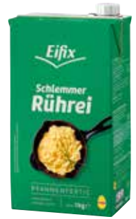
79 Schlemmer-Rührei pasteurisiert, flüssig, küchenfertig, gewürzt, 12 Packungen à 1000 g/Karton