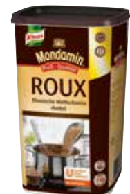
49 ROUX Klassische Mehlschwitze „dunkel“ Bindemittel, trocken, o.d.Z., 6 Dosen à 1 kg/Karton