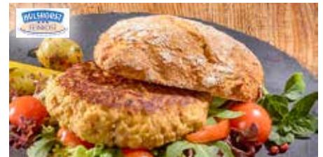
6 Geflügelfrikadelle von mittelfeiner Körnung, vereinzelt Zwiebelstücke und Gewürze erkennbar, ohne Fett gebraten, I.Q.F., im Schlauchbeutel, 30 x ca. 120 g, 3,6 kg/Karton ❄️