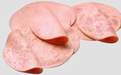
81 Delikatesse Puten-Aufschnitt 3-fach 6 x 500 g/Karton