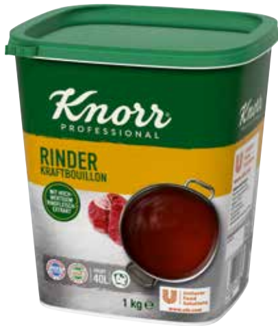
45 KNORR Rinder Kraftbouillon o.d.Z., o.d.A., ohne Suppengrün, Dose ergibt 40 Liter, 6 Packungen à 1 kg/Karton