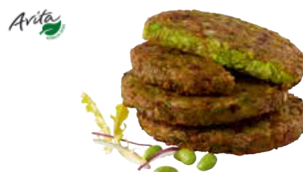
14 Edamame Burger vorgebacken, Innovatives Burger-Patty aus stückigen Edamame-Bohnen, abgeschmeckt mit Jalapenos und feinen Gewürzen, 100 g/Stück, 2 x 2 kg/Karton ❄️