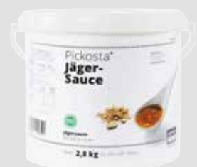
91 Jägersauce ohne deklarationspflichtige Zusatzstoffe, instant, ergibt ca. 24,5 Liter, 2,8 kg/Eimer