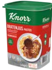
43 KNORR Bratenjus Gourmet-Qualität, pastös, instant, o.d.Z., Dose ergibt 15 Liter, 6 Packungen à 1,4 kg/Karton