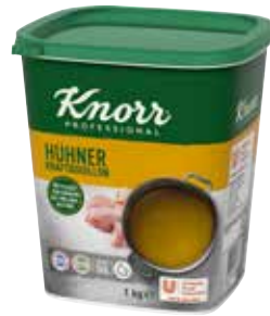
41 KNORR Hühner Kraftbouillon o.d.Z., o.d.A., Dose ergibt 50 Liter, sofort löslich, 6 Dosen à 1 Liter/Karton