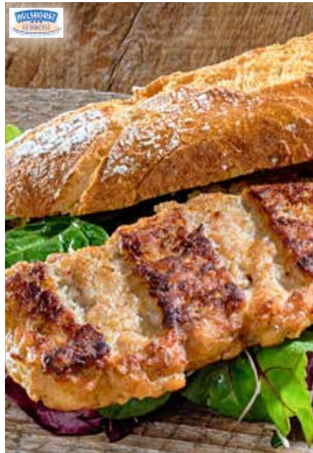
5 BIG RIB pikant gewürztes Schweinehackfleischergebnis in Spare Rib-Form, ohne Fett gebraten, I.Q.F., im Schlauchbeutel, ca. 115 g/Stück, 2 x 2,3 kg/Karton ❄️