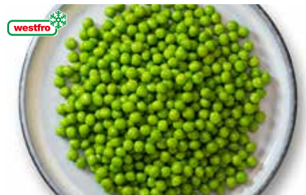
33 Markerbsen fein 4 Beutel à 2,5 kg/Karton