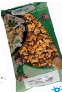
32 Pfifferlinge mittelfallend 15-30 mm, blanchiert und schock- gefrostet, 5 Beutel à 1 kg/Karton