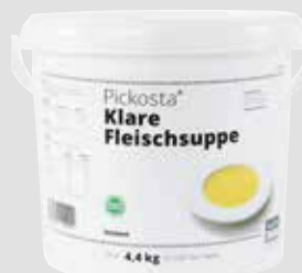
90 Klare Fleischsuppe ohne deklarationspflichtige Zusatzstoffe, instant, ergibt ca. 200 Liter, 4,4 kg/Eimer