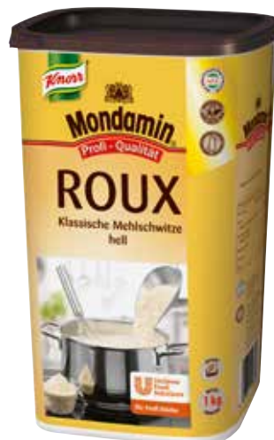
48 ROUX Klassische Mehlschwitze „hell“ Bindemittel, trocken, o.d.Z., 6 Dosen à 1 kg/Karton