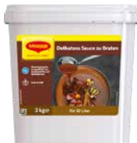
64 MAGGI Delikatess Sauce zu Braten Box ergibt 32 Liter, 2 Boxen à 3 kg/Tray