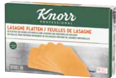
55 KNORR Lasagne Platten vorgegart, o.d.Z., 10 Folien à 5 Platten, für 1/1 Gastro-Norm-Bleche, 50 Stück, 10 kg/Karton