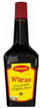
61 MAGGI Würze 6 Flaschen à 0,81 Liter/Karton