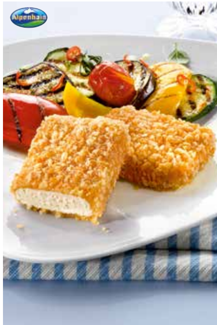
26 Back-Käse „Athena“ eckig milder Weichkäse aus Kuhmilch mit Kartoffel- panade paniert und knusprig vorgebacken, ca. 30 Stück à 75 g, 2,25 kg/Karton