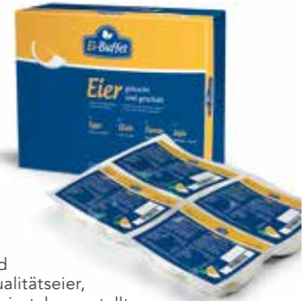
82 Eibuffet gekochte und geschälte Qualitätseier, einzeln deklariert, hergestellt mit Eiern aus Bodenhaltung, 8 x 5 Stück im Portionsbeutel/Karton