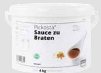
87 Sauce zu Braten ohne deklarationspflichtige Zusatzstoffe, instant, ergibt ca. 44 l, 4 kg/Eimer