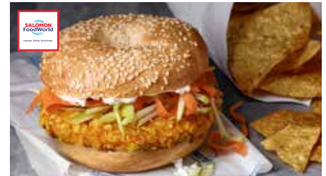
7 Crunchy Chick'n Burger gegart, in würziger Panade, 15 - 17 Stücke, 135 g/Stück, 4 x 1,5 kg/Karton ❄️