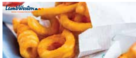
28 Twister die Twisters mit der knusprigen Hülle sind wunder- bare, optisch ansprechende Leckerbissen, aus der ganzen Kartoffel geschnitten und geschmacklich genau so hervorragend wie sie aussehen, lange Standzeit, Konvektomat geeignet, 4 Beutel à 2,5 kg/Karton