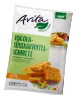
15 Rucola-Süßkartoffel-Schnitte hergestellt aus aromatischen Süßkartoffeln und würzigem Rucola, eine lockere Füllung mit spürbaren Raspeln und leckeren Süßkartoffelstückchen, umhüllt von einer knusprigen Kruste, ca. 100 g/Stück, 2 x 2,5 kg/Karton ❄️