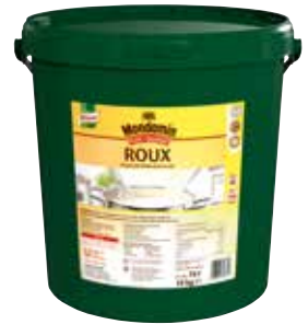
46 ROUX Klassische Mehlschwitze „hell“ Bindemittel, trocken, o.d.Z., 10 kg/Eimer