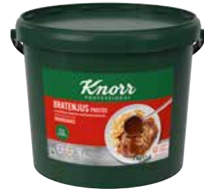
42 KNORR Bratenjus Gourmet-Qualität, pastös, instant. o.d.Z., Eimer ergibt 76 Liter, 7 kg/Eimer