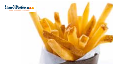
31 Stealth Fries Skin on 11x11 mm mit Schale, extra lange Standzeit, mit unserer patentierten Hülle bleiben die Stealth Pommes besonders lange knusprig, 4 Beutel à 2,5 kg/Karton