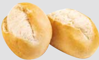
86 Meisterbrötchen fertig gebacken, 4x 25 Stück à 75 g/Karton