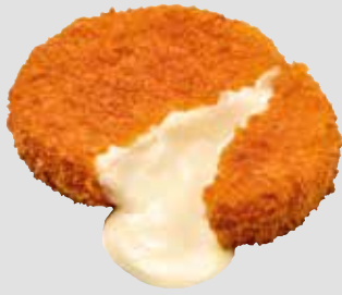
24 Back-Camembert paniert und vorgebacken, ca. 30 Stück à 75 g, 2,25 kg/Karton