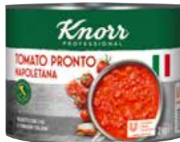
56 KNORR Pronto Napoletana Tomatensauce stückig, 6 Dosen à 2 kg/Karton