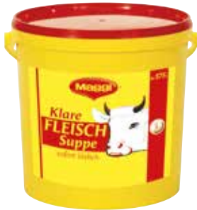
62 MAGGI Klare Fleischsuppe Eimer ergibt 575 Liter, 12,5 kg/Eimer