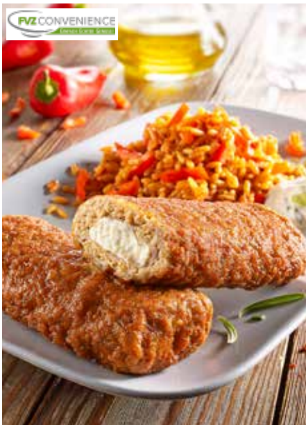
4 Hirtenrolle, griechische Art Hackfleischrolle aus Schweinefleisch, gefüllt mit einer Frischkäsezubereitung, frischen Zwiebeln und Knoblauch, mit typischer Geschmacksnote, fertig gebraten, Kombidämpferfertig, 30 Stück à 120 g/Karton ❄️