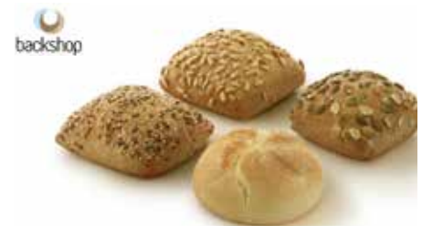
85 4-Brötchenmix bestehend aus Kaiser-, Mehrkorn-, Kürbiskern- und Sonnenblumenbrötchen, 70 bzw. 85 g/Stück, 4 x 25 Stück/Karton