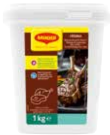
59 RÔTIDOR Universal okA Würzmischung für Fleisch, 6 Packungen à 1 kg/Tray