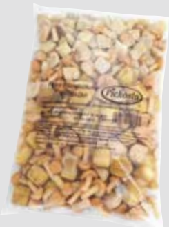
30 Feine Pilmischung Butter/Austern/Stock/Egerl-Pilze, 5 Beutel à 1 kg/Karton