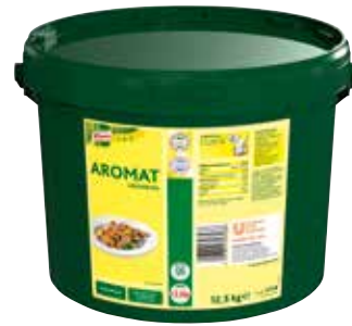
51 KNORR Aromat Universal Würzmittel, o.d.Z., o.d.A., 12,5 kg/Eimer