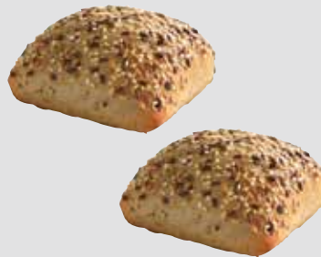
84 Mehrkornbrötchen 4 Beutel à 25 Stück, 100 Stück à 85 g/Karton