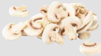
27 Champignon-Scheiben 4 Beutel à 2500 g/Karton