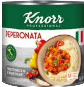
53 KNORR Peperonata Paprikasauce stückig, 6 Dosen à 2,6 kg/Karton