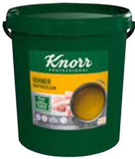
40 KNORR Hühner Kraftbouillon 12,5 kg/Eimer