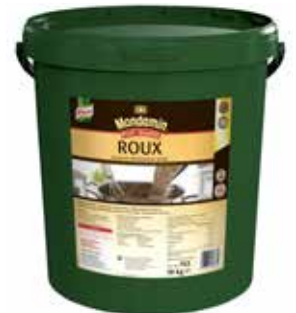
47 ROUX Klassische Mehlschwitze „dunkel“ Bindemittel, trocken, 10 kg/Eimer