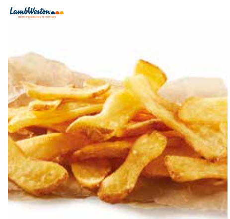
34 Connoisseur Wavy Fries Müheleose Zubereitung für einen beeindruckenden Auftritt! Die Pommes Spezialität in unverwech- selbarer Form, hausgemachter Qualität und mit unwiderstehlichen Geschmack Unsere Connoisseur Wavy Fries überzeugen durch einen natürlichen, handgeschnittenen Look. Jede einzelne Pommes Frites begeistert durch ihre einzigartige Form, ver- leiht deinem Gericht eine besondere Note und ist die perfekte Beilage für Burger oder Steak.