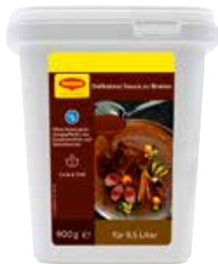
63 MAGGI Delikatess Sauce zu Braten OK 6 Packungen à 900 g/Tray