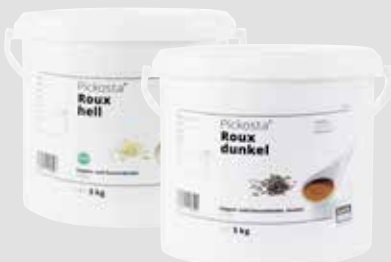
Roux Mehlschwitze, odpZ, einfach zu dosieren, ohne zu klumpen, 5 kg/Eimer