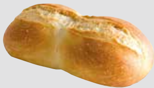
83 Doppelweck zwei aneinander gebackene Weizenbrötchen, 60 Stück à 120 g/Karton