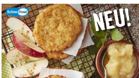
13 Reibekuchen Rustikal Reibekuchen aus grob geraspelten Kartoffeln im rustikalen Handmade-Style, ideal für die Zubereitung im Kombidämpfer, 4 x 1,5 kg/Karton ❄️