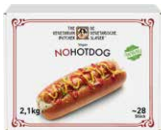
57 THE VEGETARIAN BUTCHER - NoHotDog - vegane Wurst auf Soja-Basis, 2,1 kg bzw. 28 Stück/Karton