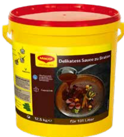
66 MAGGI Delikatess Sauce zu Braten Eimer ergibt 131 Liter, 12,5 kg/Eimer