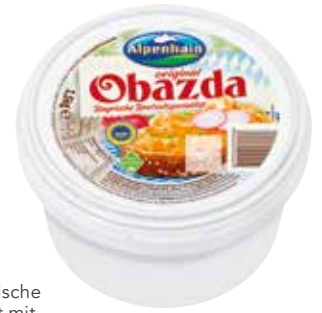
25 Obazda eine echt bayrische Käsespezialität mit Camembert aus frischer Alpenmilch, Rahm und den typischen Gewürzen, 1,5 kg/Terrine