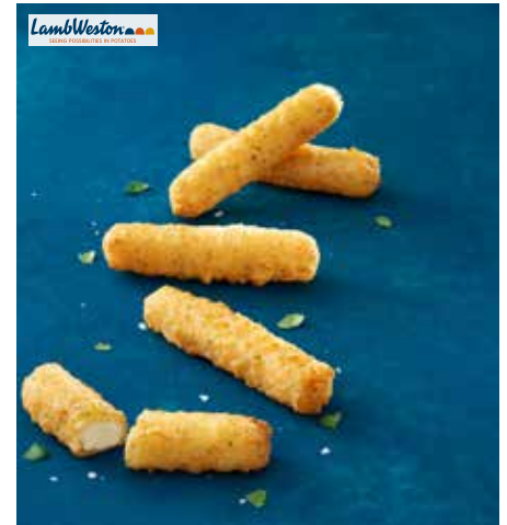
29 Cyprus Halloumi Sticks seit der Antike stellen die Bürger Zyperns den köstlichen, festen Käse her, der als Halloumi bekannt ist, sein charakteristischer, leicht salziger Geschmack ist das Ergebnis einer Mischung aus Ziegen- und Schafsmilch, die auf traditionelle zyprische Weise gepökelt wird, gefüllt mit 100 % Halloumi-Käse, feste Textur und salziges Hallou- mi-Erlebnis in einer köstlichen knusprigen Kruste, attraktive, kleine, mundgerechte Produkte, die ein- fach zuzubereiten und leicht zu teilen sind, ein echter Leckerbissen, 6 x 1 kg/Karton