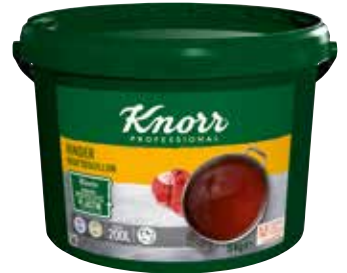
44 KNORR Rinder Kraftbouillon 5 kg/Eimer