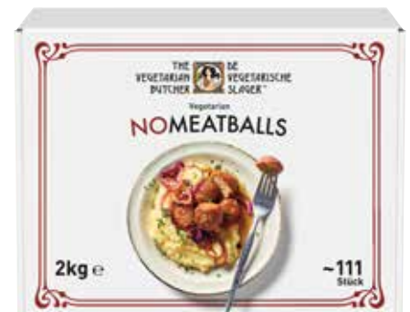
58 THE VEGETARIAN BUTCHER - No Meatballs - vegetarische Hackbällchen auf Pflanzenprotein-Basis, 2 kg/Karton